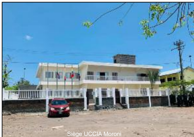
Siège UCCIA Moroni