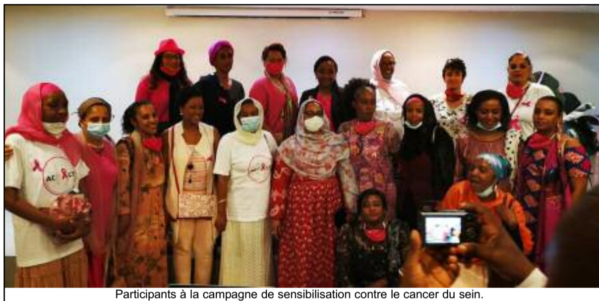
Participants à la campagne de sensibilisation contre le cancer du sein.