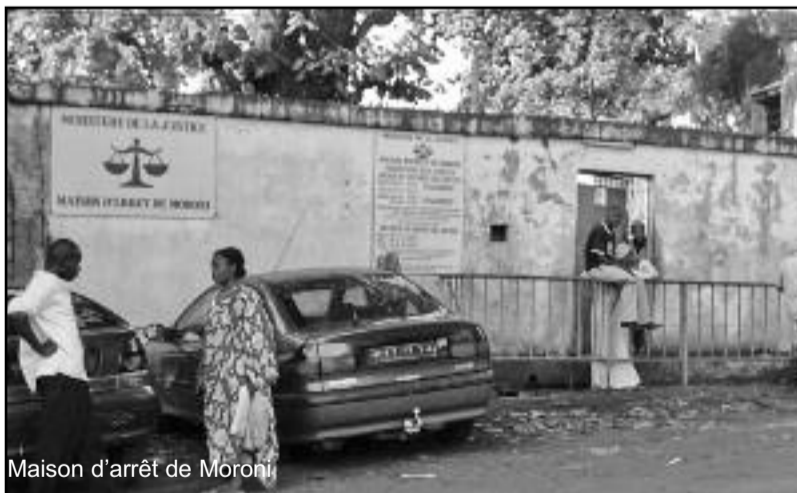
Maison d'arrêt de Moroni