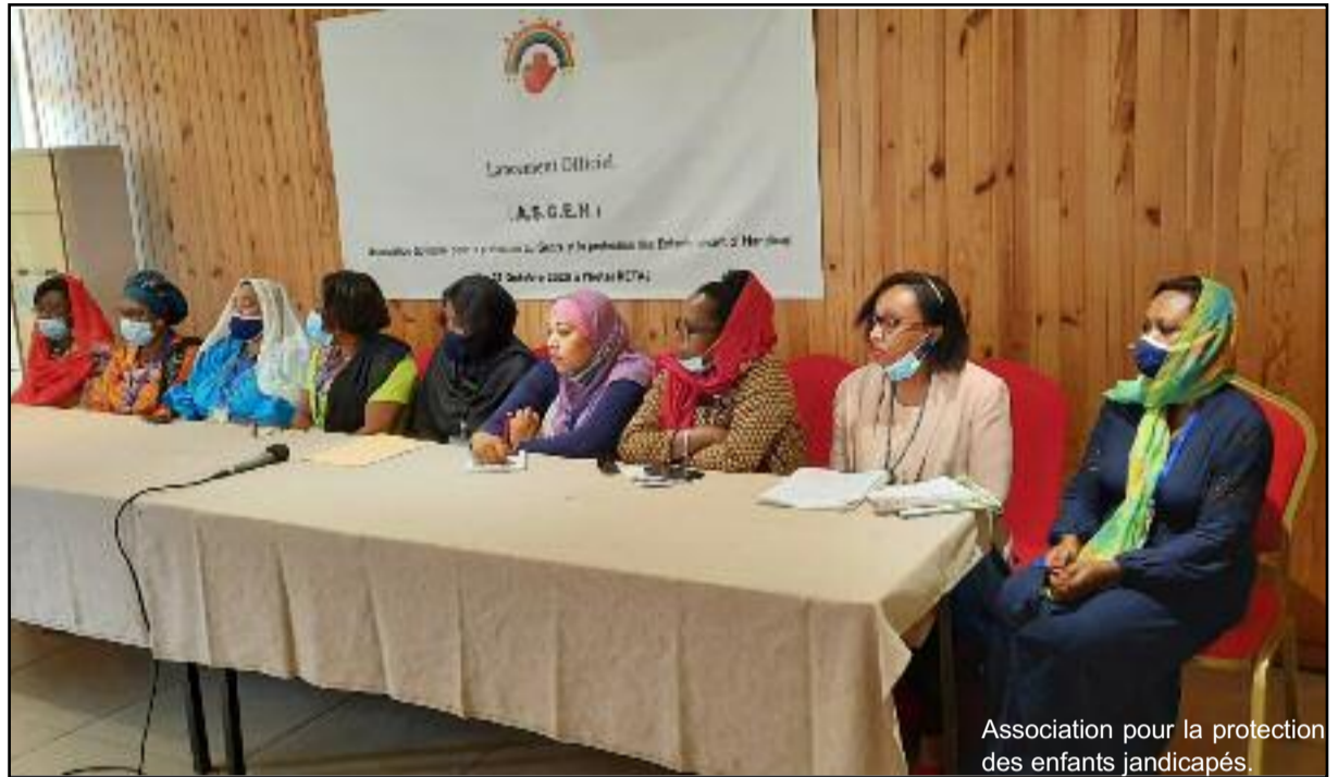
Association pour la protection des enfants handicapés.

Présente dans la cérémonie, la gouverneure de l'île de Ngazidja dit soutenir cette noble cause comme lorsqu'elle l'a fait quand elle était commissaire au genre. « Un tel projet va permettre aux parents d'enfants concernés de sortir de leur isolement et rendre possible une socialisation nécessaire de l'enfant », lance-t-elle, avant d'ajouter que « pour ma part, je serais de votre côté sur cette démarche et vous soutiendrai dans tous les domaines. Le respect de l'intégrité physique, de l'intimité, de l'accès à l'éducation et à la santé fait partie intégrante de ces enfants vivant une telle situation. C'est pourquoi je m'engage à cette