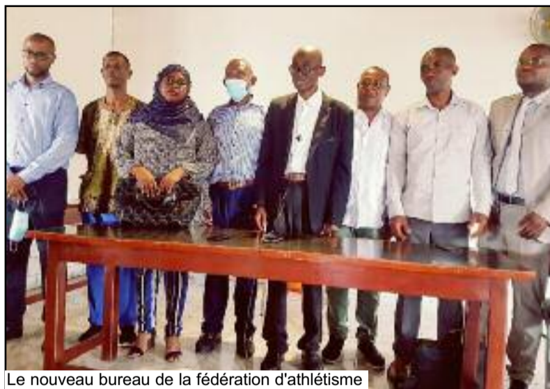
Le nouveau bureau de la fédération d'athlétisme

Le président sortant a présenté trois bilans : moral, technique et financier. Les points cruciaux à retenir sont, entre autres, l'homologation prochaine des pistes du complexe omnisports de Maluzini par des experts internationaux, la perspective de revoir les Comores briller dans cinq compétitions internationales, l'adhésion des Comores à la Fédération Arabe d'Athlétisme et au World Masters Athletics, institution internationale des vétérans.