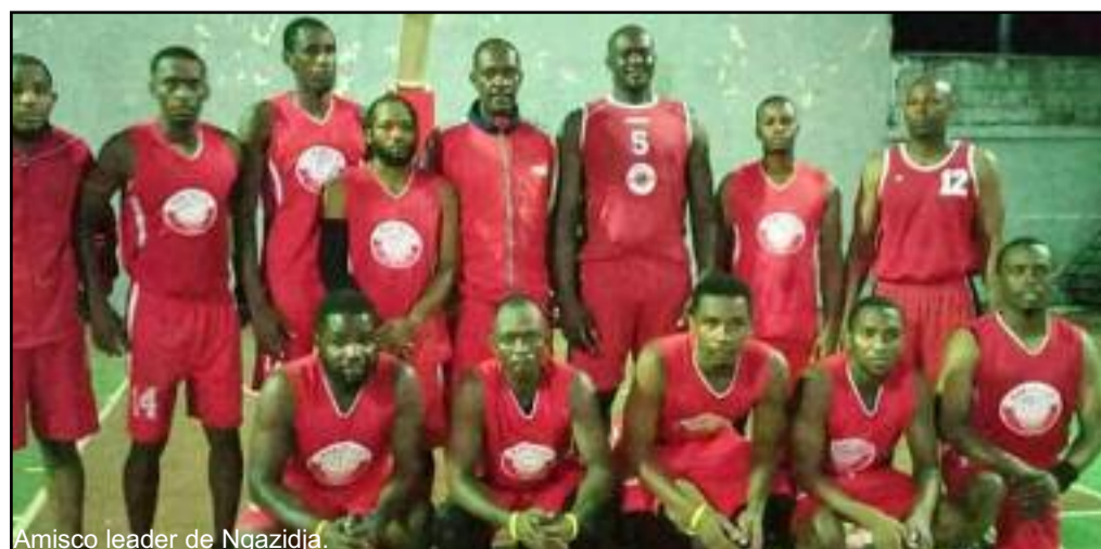
Amisco leader de Ngazidja.