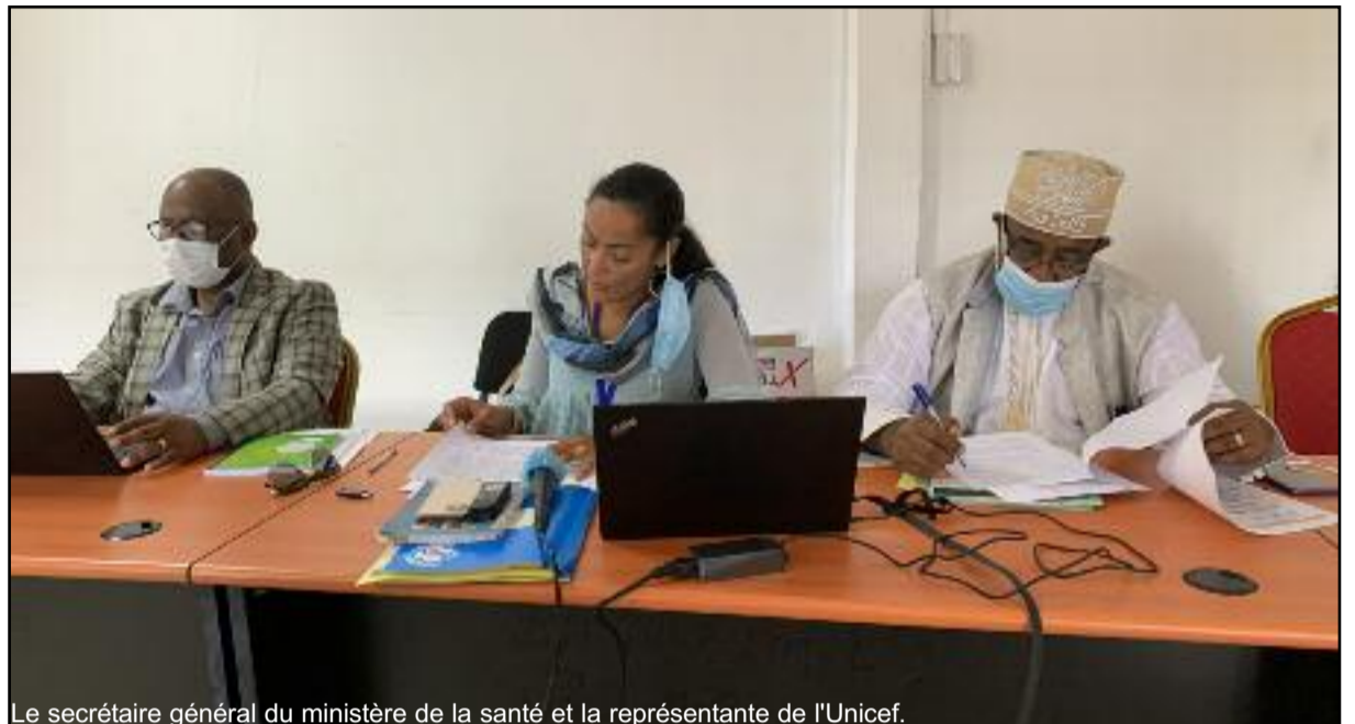
Le secrétaire général du ministère de la santé et la représentante de l'Unicef.

De son côté, l'Unicef aux Comores a montré que cette pandémie continue d'avoir un effet indé-