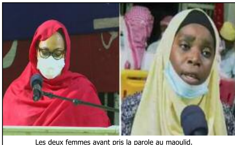
Les deux femmes ayant pris la parole au mawlid.