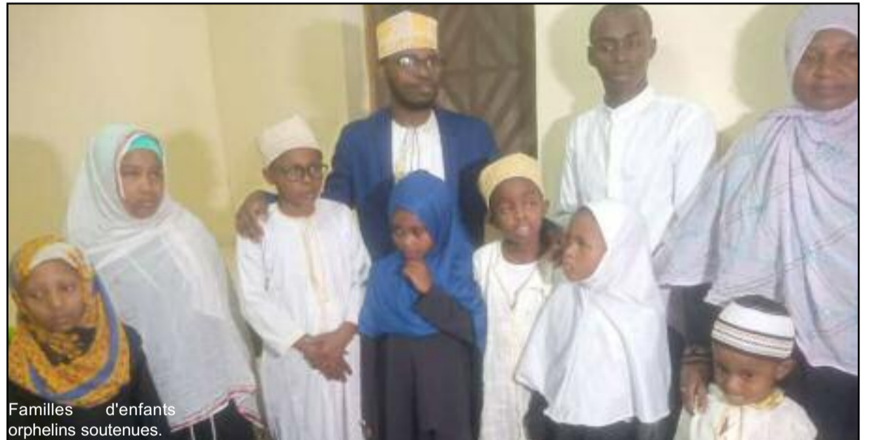
Familles d'enfants orphelins soutenues.