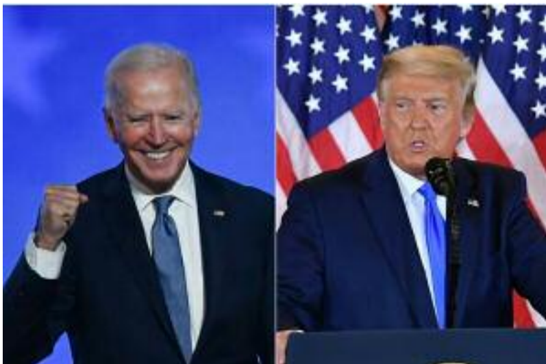
Des responsables électoraux comptent les votes anticipés à Milwaukee, dans l'Etat-clé du Wisconsin, le 4 novembre 2020

Pour la première fois depuis 2000, les Américains se sont réveillés mercredi sans savoir le nom de leur prochain président après un vote à la participation record et dont le dépouillement se poursuivait dans sept Etats-clés, ce qui n'a pas empêché Donald Trump de s'estimer vainqueur contre le démocrate Joe Biden.