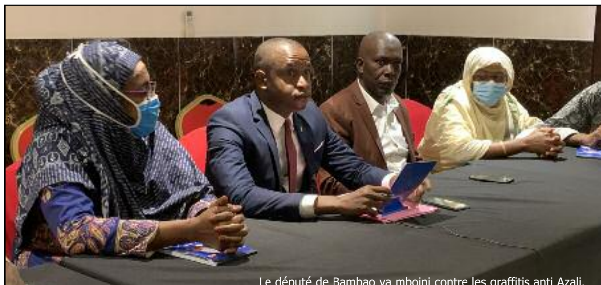
Le député de Bambao ya mboini contre les graffitis anti Azali.