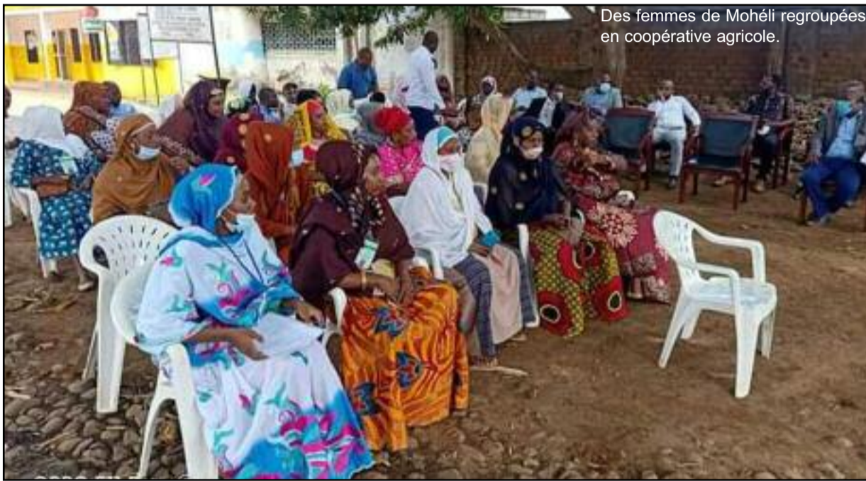
Des femmes de Mohéli regroupées en coopérative agricole.

Une cérémonie a été organisée ce matin à Bandar es Salam près de la maison de l'ANPI pour le lancement d'une l'entreprise féminine qui va travailler en coopérative sur les produits agricoles .