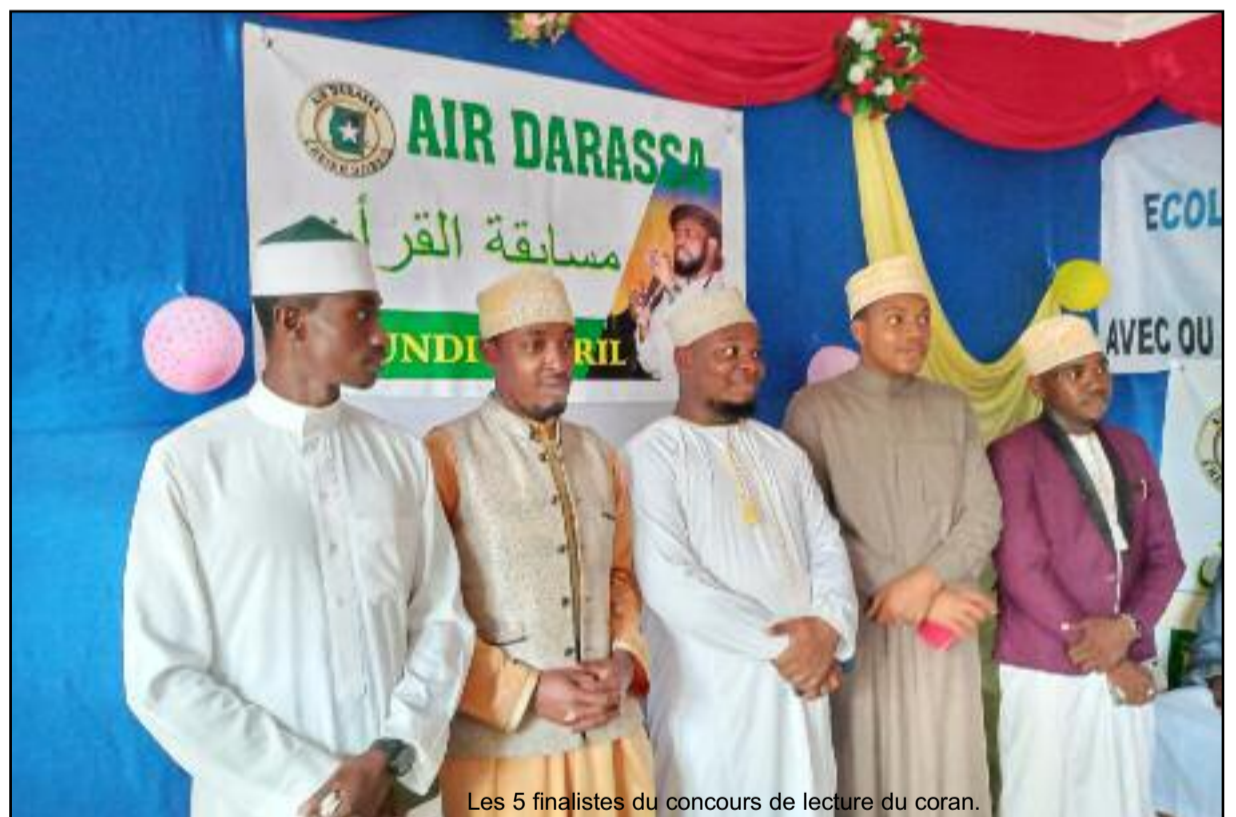
Les 5 finalistes du concours de lecture du coran.