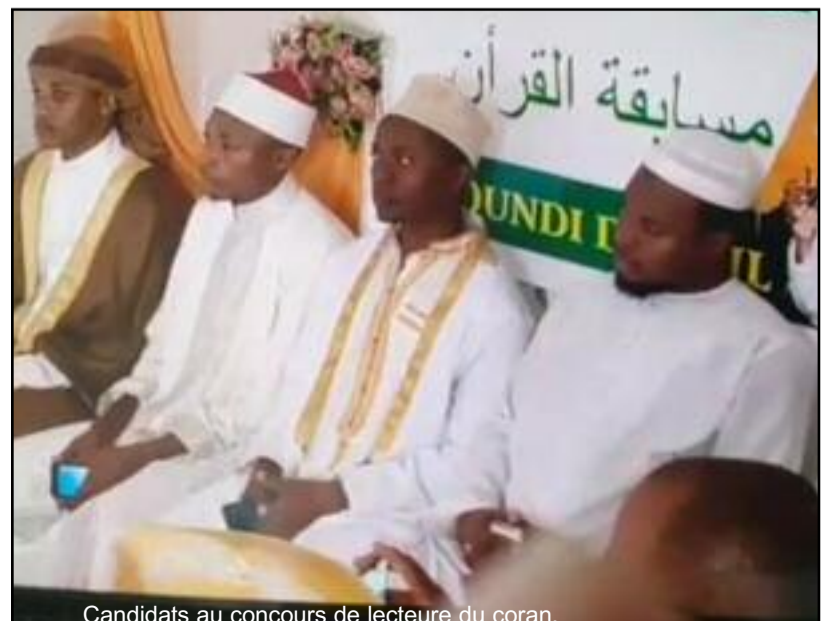
Candidats au concours de lecture du coran.