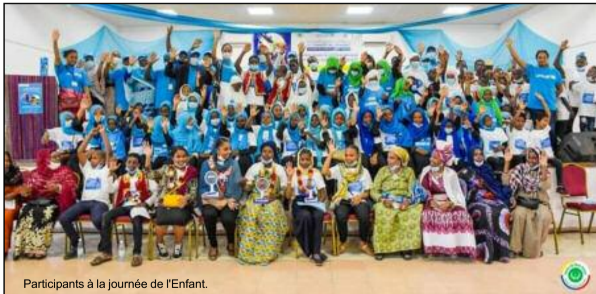
Participants à la journée de l'Enfant.

Comme chaque année, le monde célèbre la journée internationale de l'enfant, une commémoration de la convention relative aux droits de l'enfant. Aux Comores, une cérémonie a été organisée vendredi 20 novembre dernier au foyer des femmes de Moroni et a vu la présence des autorités et des acteurs de la lutte contre la violence mais également des membres des Nations-Unies. Le commissaire au genre a saisi l'occasion pour montrer que le pays est en train d'étudier une stratégie sur la protection de l'enfant. «