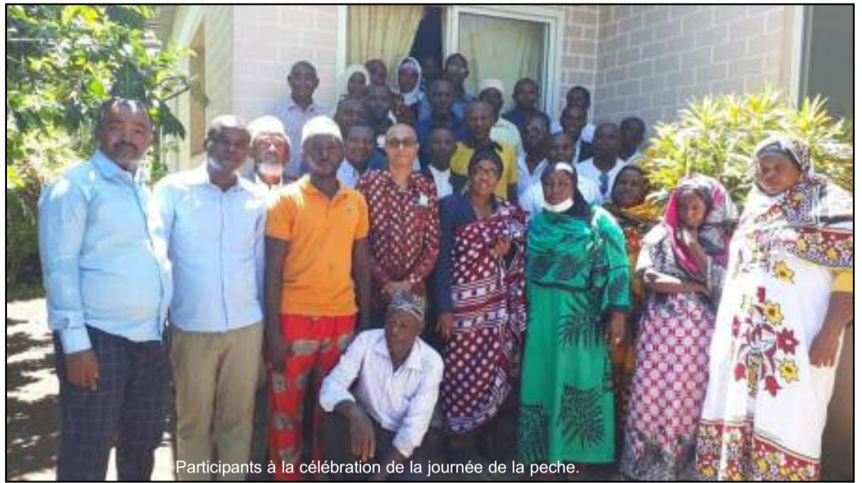
Participants à la célébration de la journée de la pêche.

En marge de la célébration de la journée mondiale de la pêche, plusieurs activités ont été organisées depuis le jeudi dernier. Parmi elles, on peut citer entre-autre la conférence de presse organisée le même jour en vue de définir la place de la femme dans la pêche comorienne mais aussi des échanges interprofessionnels sur les techniques de fumage, salage et séchage des produits halieutiques. Samedi 21