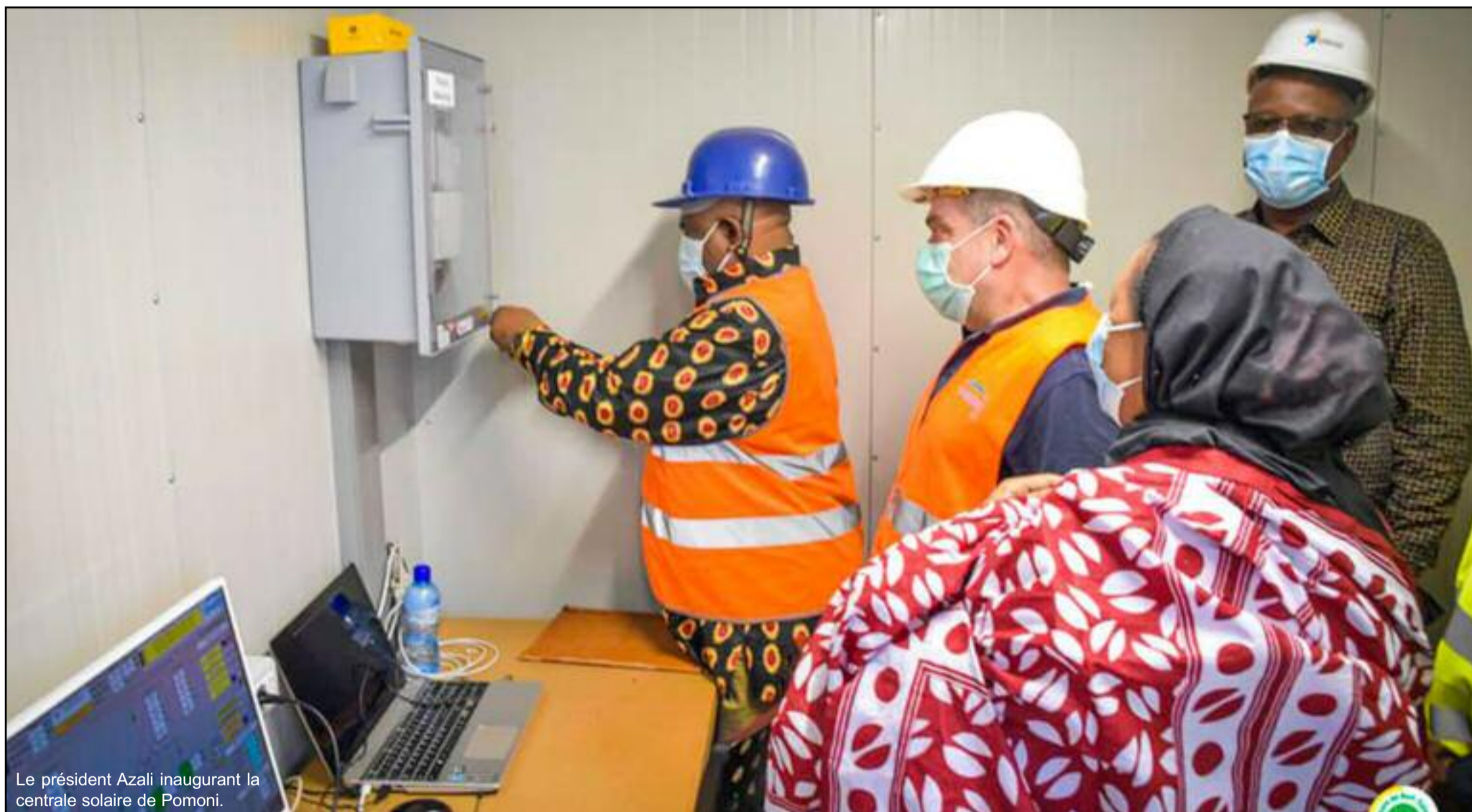
Le président Azali inaugurant la centrale solaire de Pomoni.