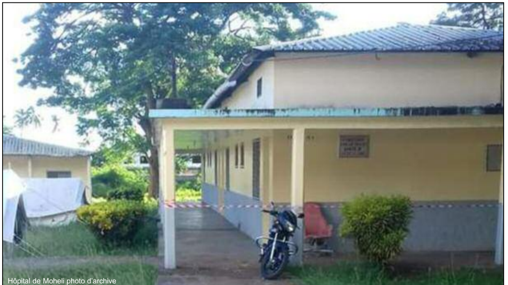
Hôpital de Mohéli photo d'archive