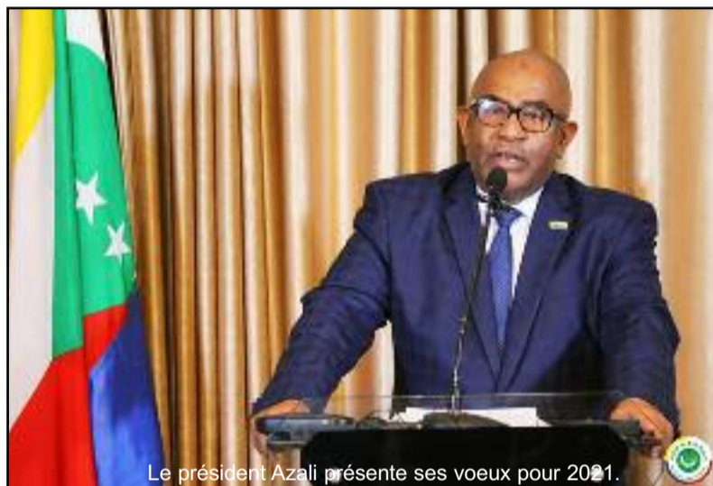
Le président Azali présente ses vœux pour 2021.

Pour les perspectives pour les trois prochaines années, le Haut Conseil de Suivi, va mettre l'accent sur la mobilisation des fonds destinés au financement de ces projets dont six projets phares sont évalués à plus de 1,7 milliards d'Euros et concernent les secteurs du tourisme, de l'énergie, des infrastructures des transports maritime et aérien, de