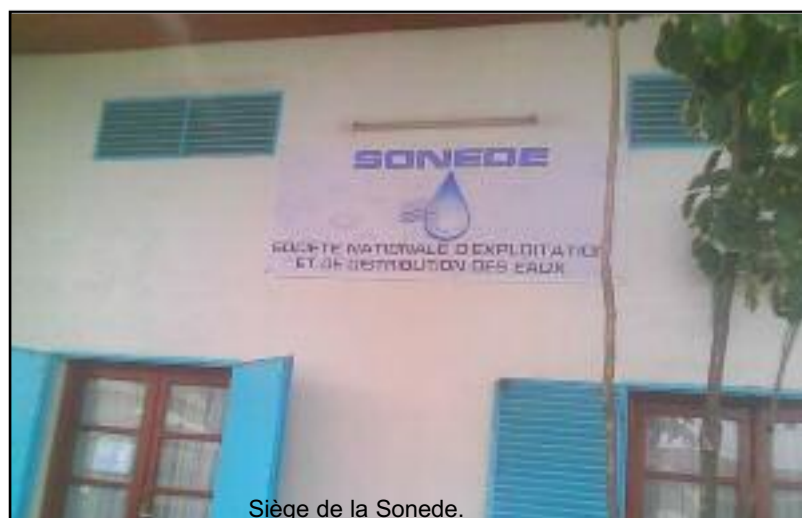
Siège de la Sonede.