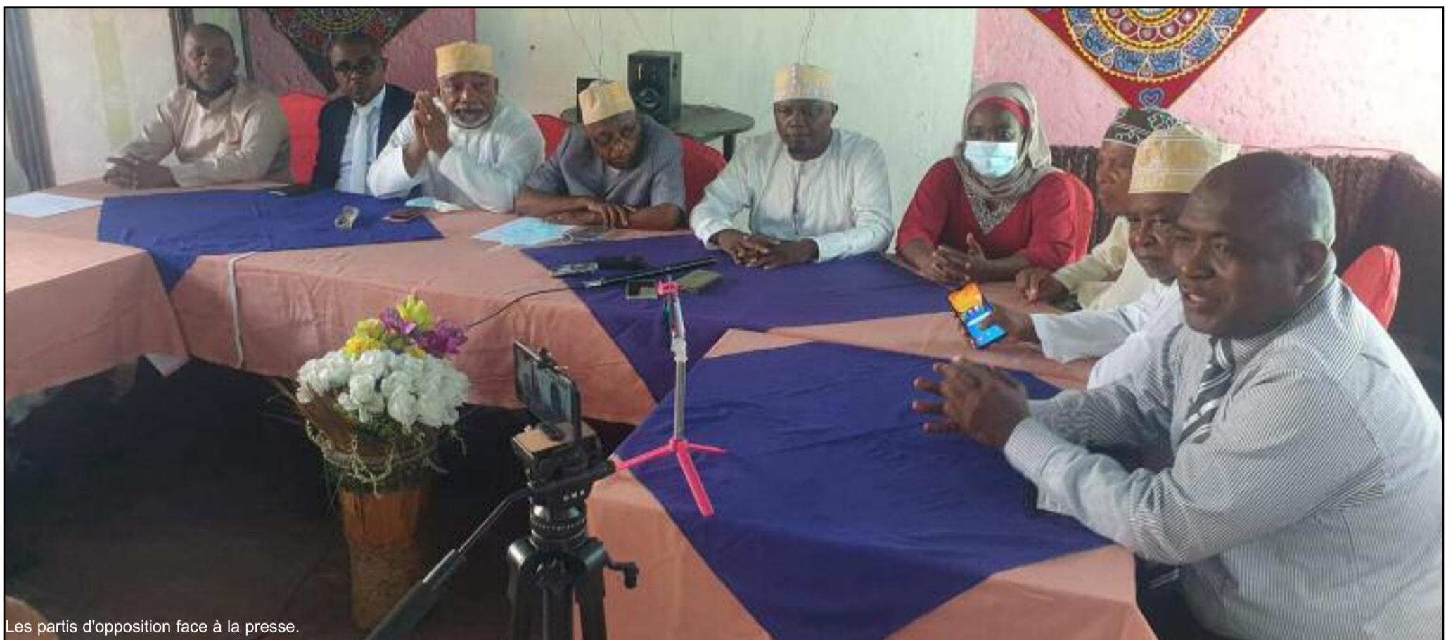
Les partis d'opposition face à la presse.