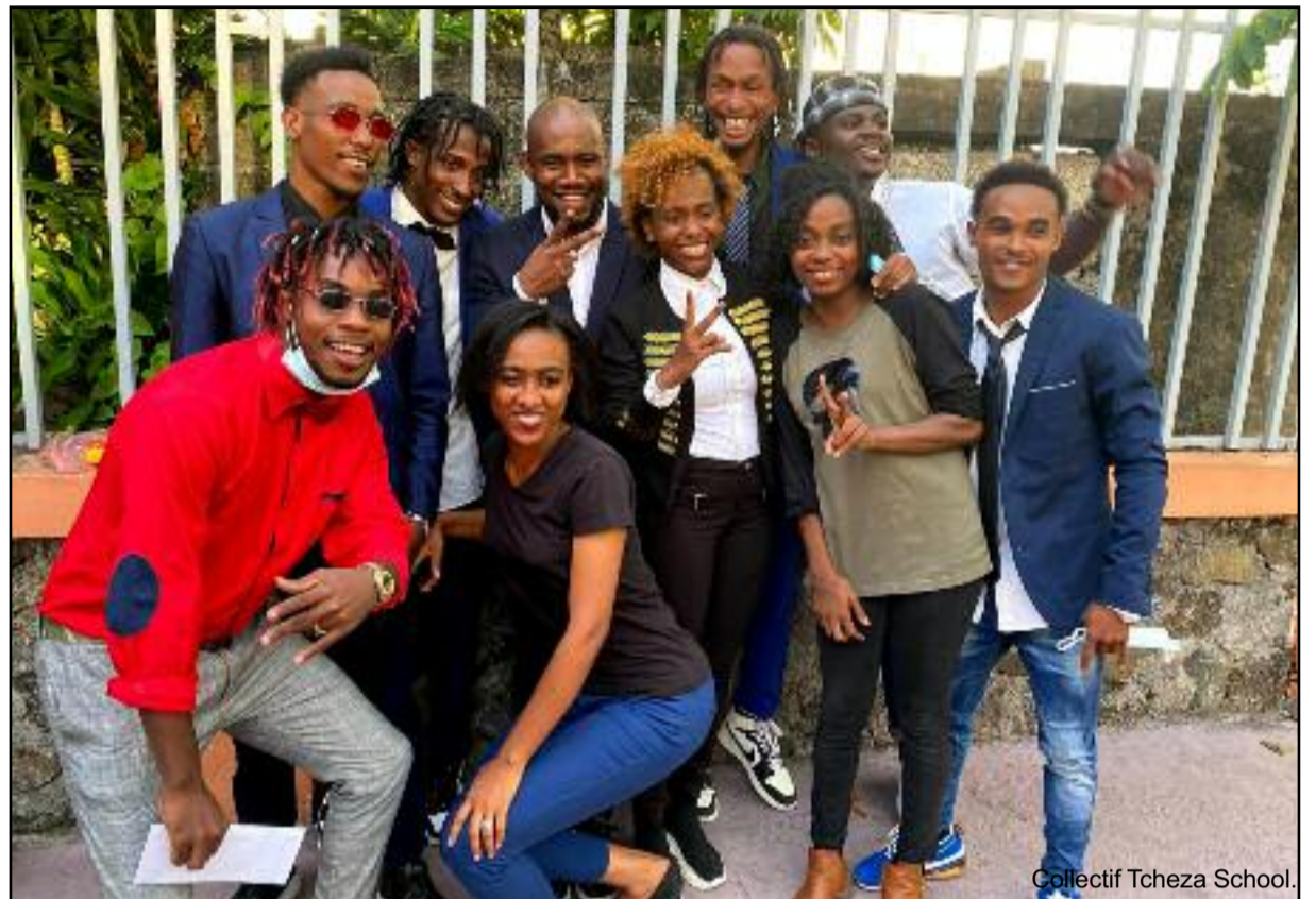
Collectif Tcheza School.

Seush et la danse, c'est une histoire qui ne date pas d'hier. Le Tché-Za lui est né de cette volonté qui animait le chorégraphe « de faire découvrir la danse comorienne dans le monde ». « Tché-Za est né à Dakar, dans des chambres d'étu-