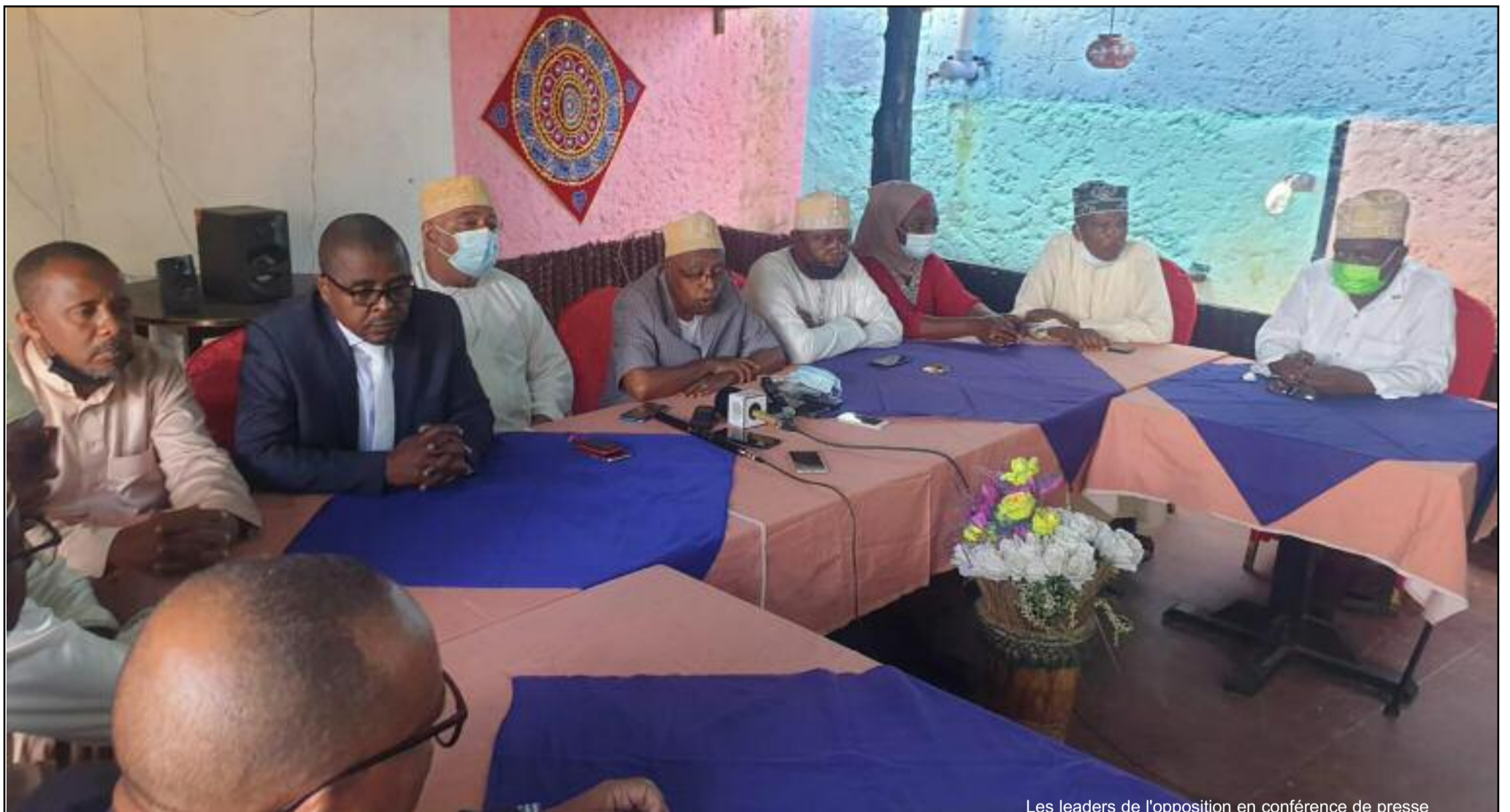
Les leaders de l'opposition en conférence de presse