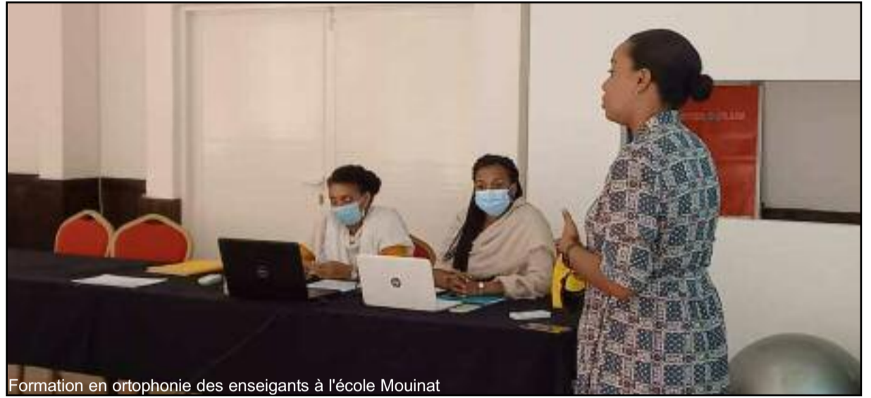
Formation en orthophonie des enseignants à l'école Mouinat