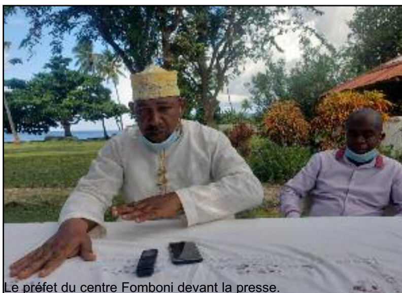
Le préfet du centre Fomboni devant la presse.