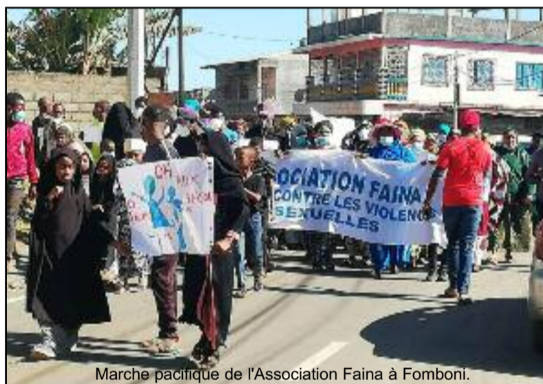
Marche pacifique de l'Association Faina à Fomboni.

Cette marche hautement sécurisée s'est arrêté au parking de Salamani après avoir fait le tour de la capitale. Ici plusieurs discours ont été prononcés. Certaines familles dont les enfants ont été victimes de viols ont saisi cette opportunité pour lancer un cri d'alarme auprès des autorités compétente, notamment la justice et la force de l'ordre. « Prenez aux sérieux ce fléau afin de mettre à terme à ces actes de viols à