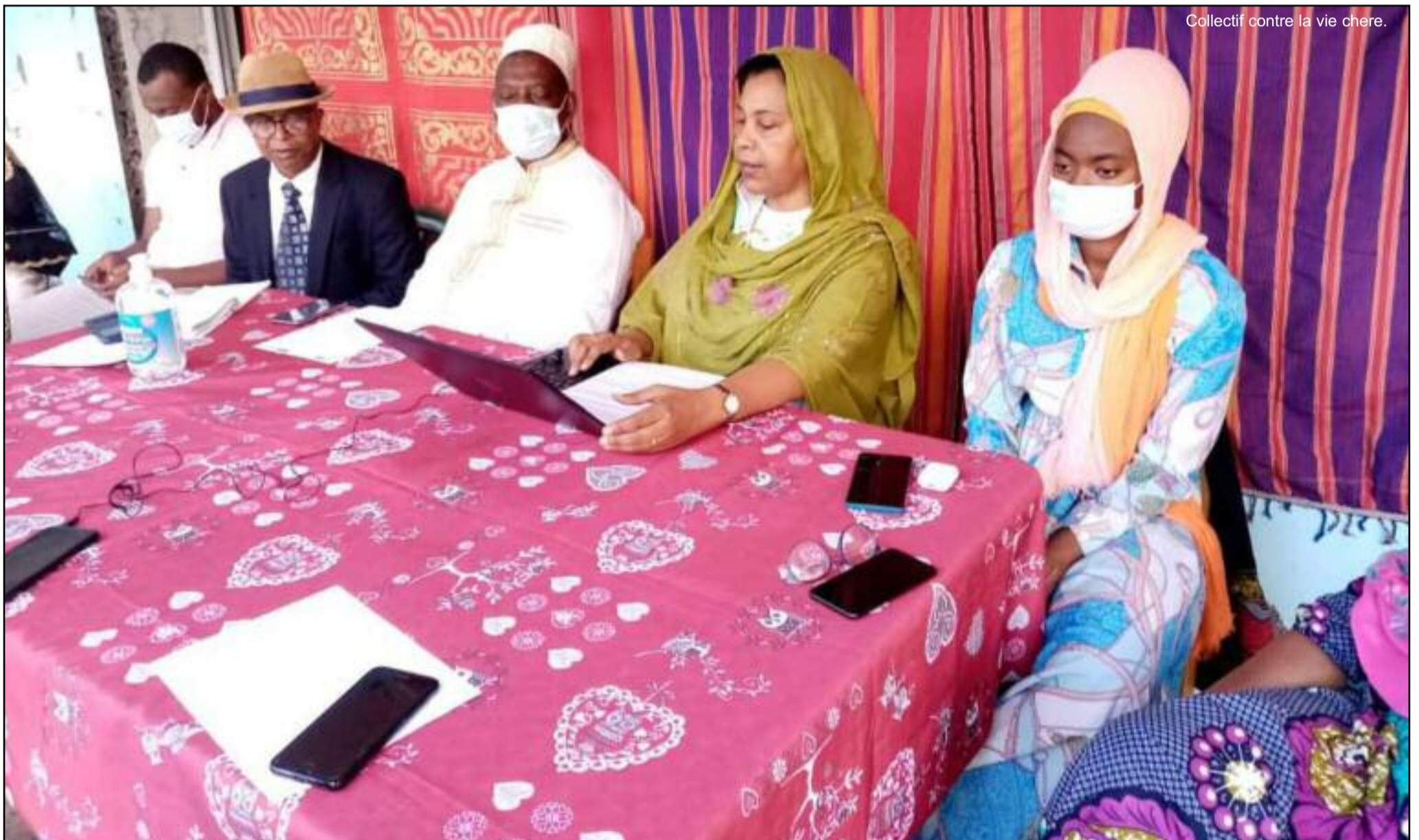
Collectif contre la vie chère.