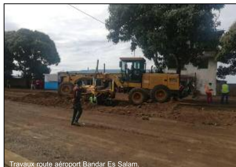
Travaux route aéroport Bandar Es Salam.

C'est l'entreprise chinoise CGC assurant les travaux d'assainisse-