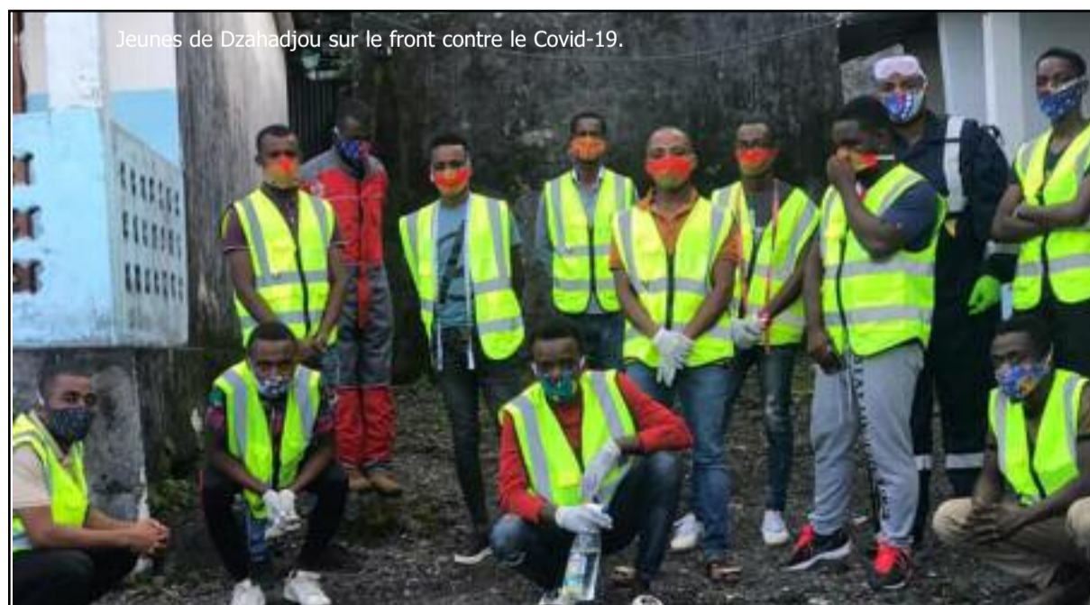
Jeunes de Dzahadjou sur le front contre le Covid-19.