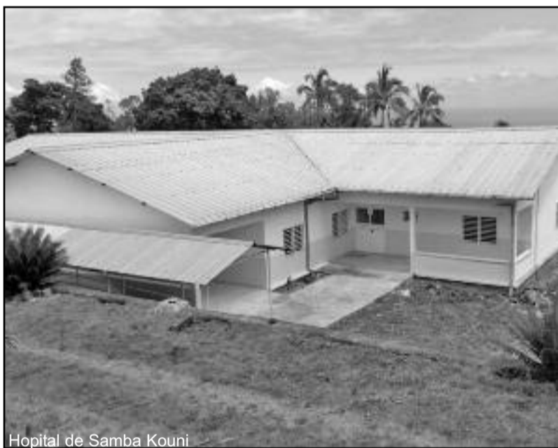
Hopital de Samba Kouni

Le constat est fait par le ministère de la santé. La Covid-19 touche plus d'hommes que des femmes. Les Comores enregistrent 56% d'hommes et 34% de femmes positifs d'une tranche d'âge qui varie entre 31 à 50 ans.