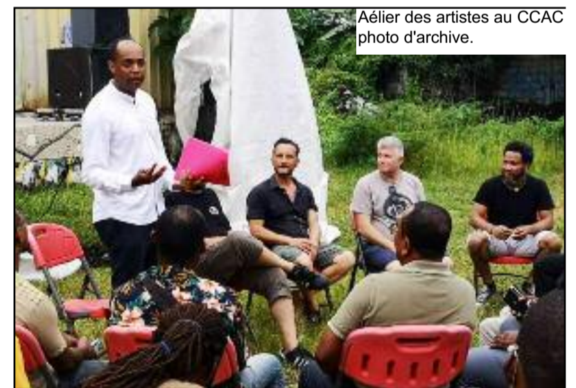
Atelier des artistes au CCAC photo d'archive.

Ce dernier rappelle que cette enquête sert à évaluer les artistes vivant aux Comores exclusivement bien que les artistes comoriens de l'extérieur comme Eliasse et Ahamada Smith peuvent y contribuer à impulser cette politique. « Il y a ces artistes comoriens qui vivent à l'extérieur mais qui viennent souvent travailler ici en organisant des ateliers et des formations, on leur a