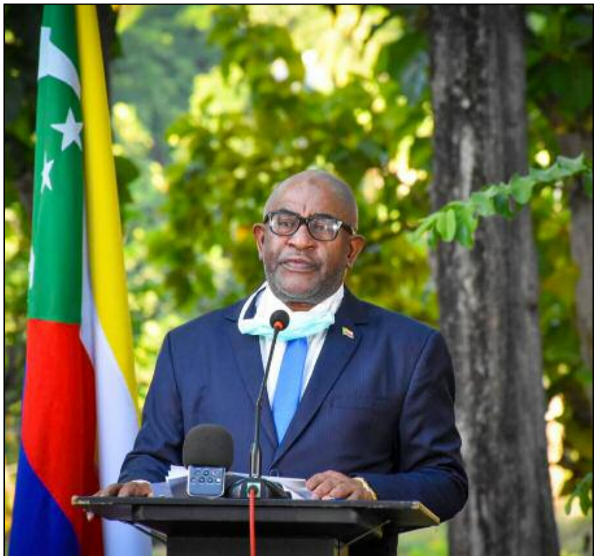
Le président Azali s'adressant à la nation depuis Mutsamudu.

L'ambassade de l'Arabie Saoudite remet ses ÉPI à la presse