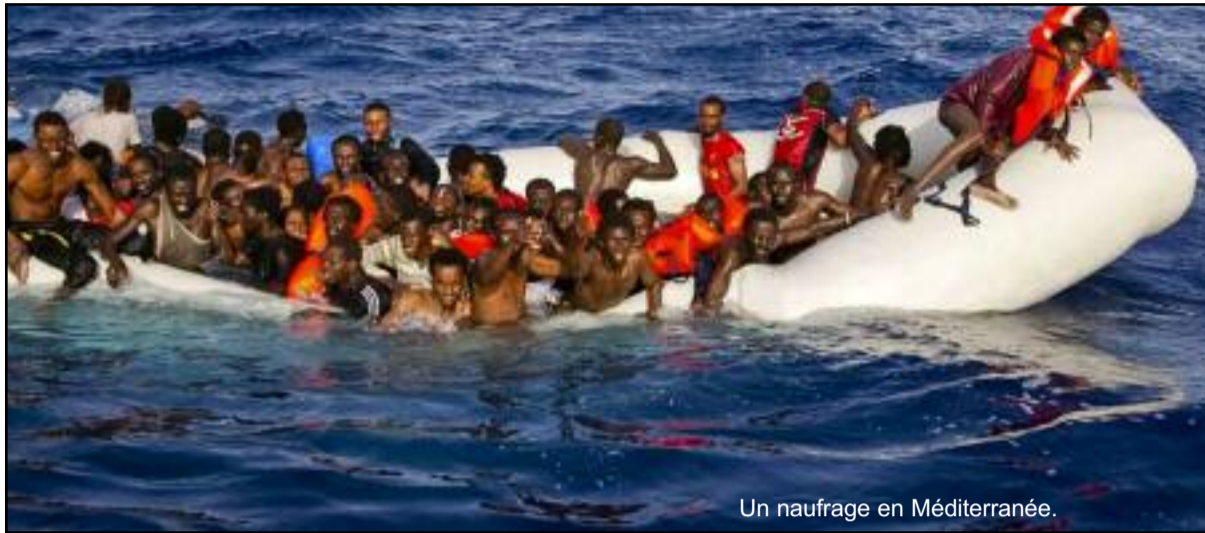
Un naufrage en Méditerranée.

53 passagers voulant rejoindre l'Italie ont perdu la vie dans un naufrage au large des côtes tunisiennes, le 9 juin dernier. Une douzaine de Comoriens feraient partie de la liste des victimes selon un média basé à Moroni. Une information qu'on n'a pas pu confirmer auprès des Affaires étrangères.