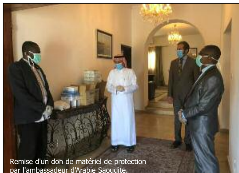
Remise d'un don de matériel de protection par l'ambassadeur d'Arabie Saoudite.