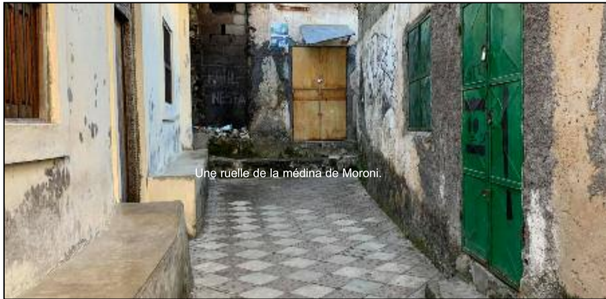
Une ruelle de la médina de Moroni.