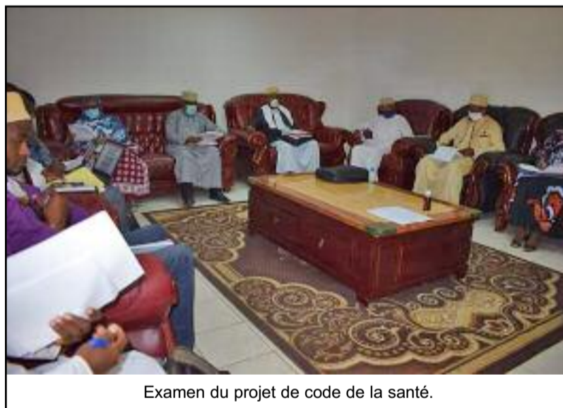
Examen du projet de code de la santé.

P our s'aligner aux ambitions du gouvernement, le nouveau code de la santé a été promulgué le 2 juillet dernier par le président de la République. Plusieurs articles ont été revus et réajustés comme sur les établissements tels que l'Ocopharma, l'Anamev, le Centre de transfusion sanguine, l'Agence nationale de la technologie hospitalière et d'autres. Selon l'inspecteur des services de santé, Farid Dhouhari, le principal but du