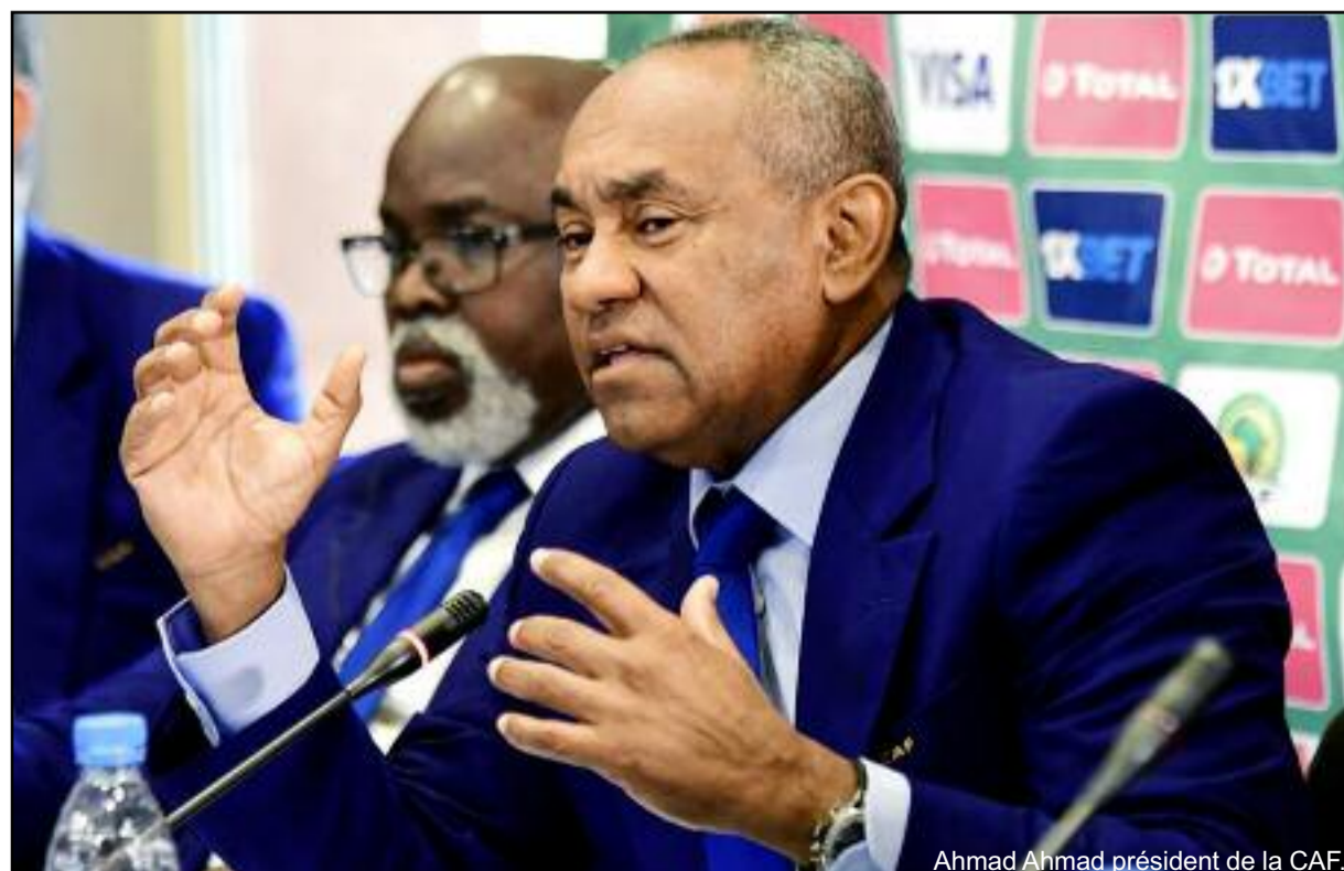
Ahmad Ahmad président de la CAF.