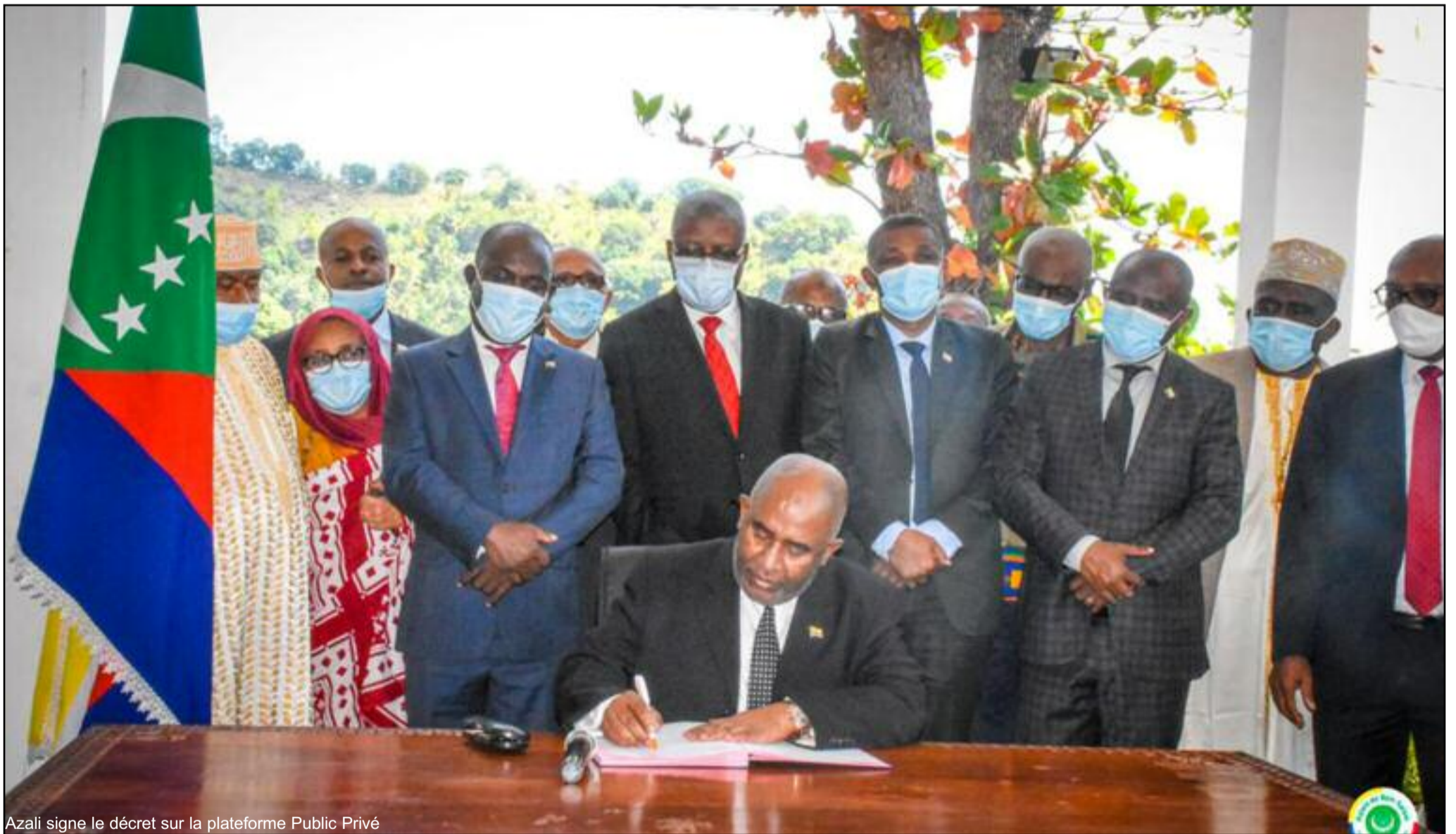
Azali signe le décret sur la plateforme Public Privé

JOURNÉE INTERNATIONALE DE LA JEUNESSE : Des actions pour protéger les mineurs face aux agressions sexuelles