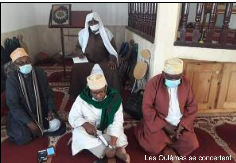
Les Oulémas se concertent

Les Oulémas et Hatubs comoriens condamnent les violences faites contre les enfants et les femmes aux Comores. C'est à l'issue d'une rencontre qui a eu lieu hier mercredi à Moroni sous la présidence du Muftorat que les hatubs et prédicateurs des Comores se sont mis d'accord de retrousser les manches.