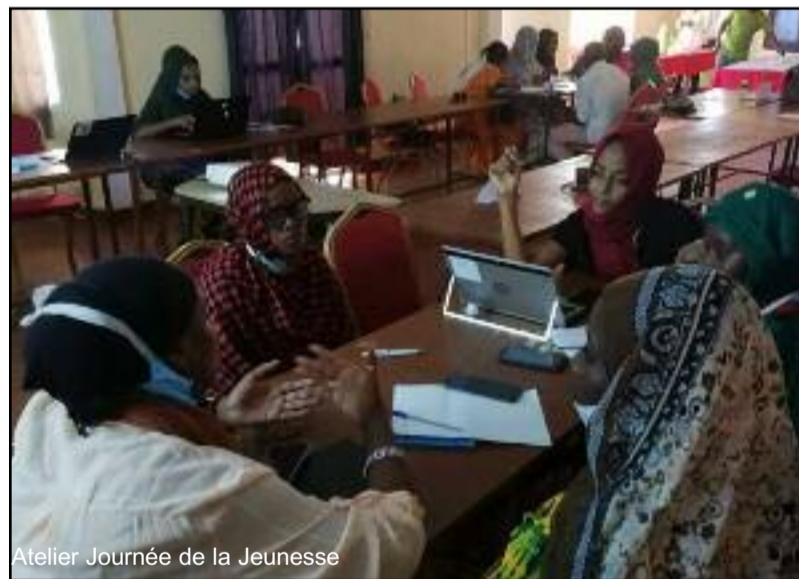
Atelier Journée de la Jeunesse