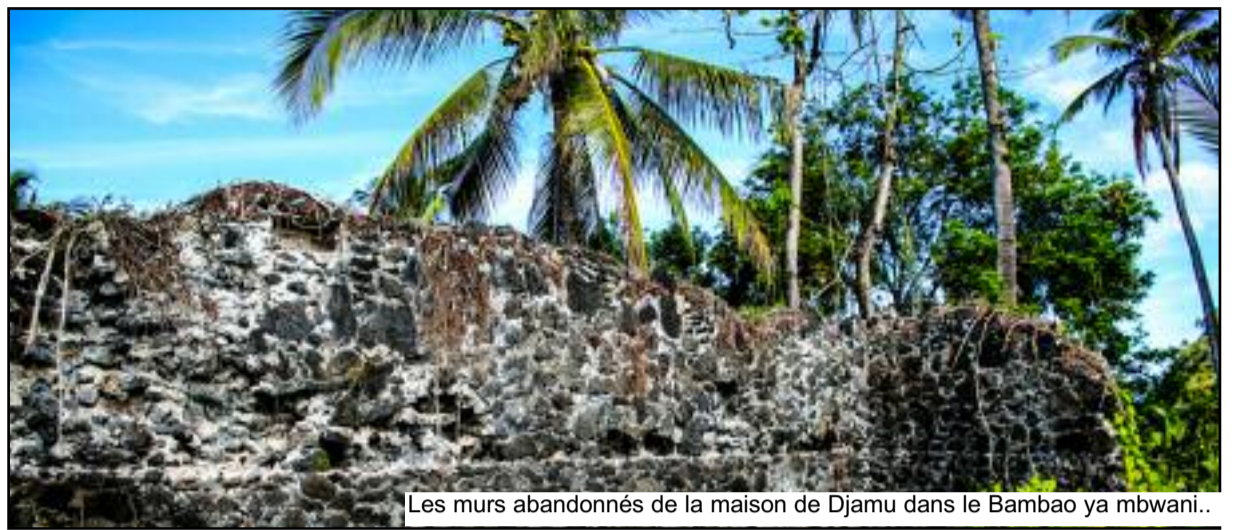
Les murs abandonnés de la maison de Djamu dans le Bambao ya mbwani..

Nous pouvons donc nous poser les questions suivantes : le refus ou la résistance de la population d'aller enregistrer ou immatriculer leur terre auprès des services de l'Etat ou auprès du cadastre n'est-il pas l'illustration parfaite d'un décalage, dans la conception même du rapport à la terre, entre des modes de juridictions importés, imprégnés d'autres valeurs humaines, et des pratiques locales qui, au contraire, sont inhé-