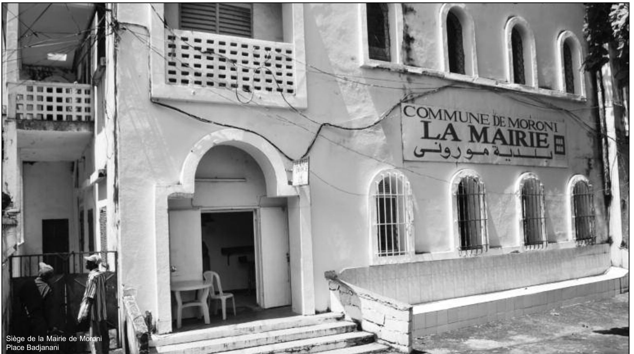
Siège de la Mairie de Moroni Place Badjanani