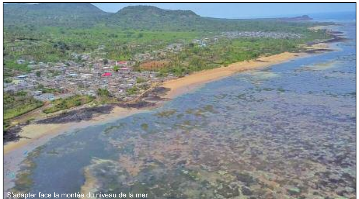
S'adapter face la montée du niveau de la mer

Il convient de noter pour mémoire, que les activités du FVC sont alignées sur les priorités des pays en développement grâce au principe de l'appropriation par les pays, et le Fonds a établi une modalité d'accès direct afin que les organisations nationales et infranationales puissent recevoir des financements directement, plutôt que seulement via des intermédiaires internationaux. Le Fonds accorde une attention particulière aux besoins des sociétés qui sont très vulnérables aux effets du changement climatique, en particulier les pays les