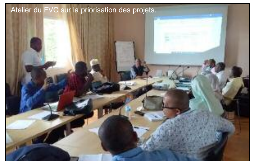
Atelier du FVC sur la priorisation des projets.

Avant d'arriver à la phase finale de ce processus, les autorités auront à mettre en place l'Autorité Nationale Désignée qui doit jouer le rôle de point de contact avec le fonds vert Climat, elle délivre la lettre de non-objection, coordonne l'élaboration du programme-pays avec un engagement des parties prenantes dans ce processus, vérifie la cohérence des propositions de projets