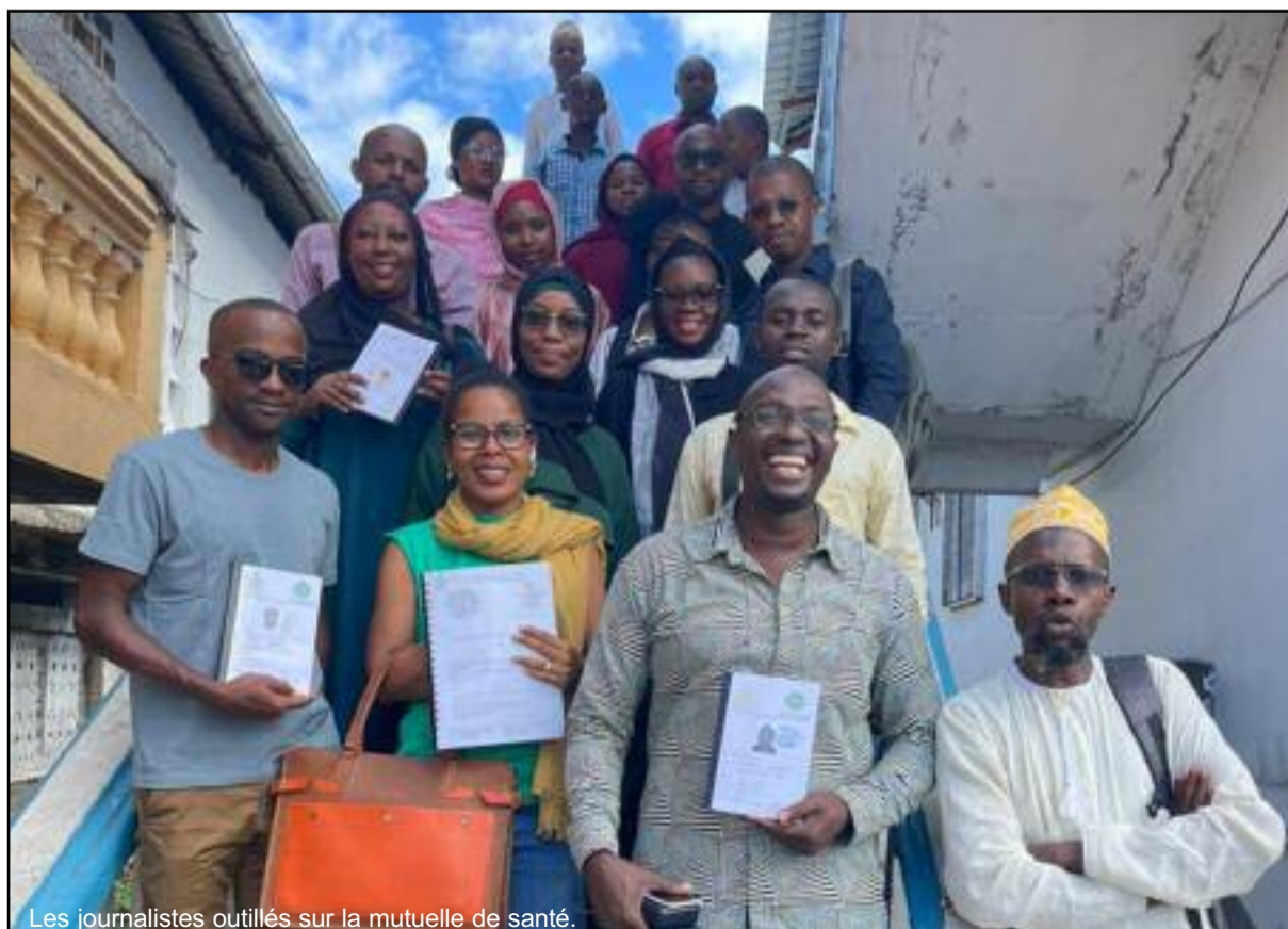
Les journalistes outillés sur la mutuelle de santé.