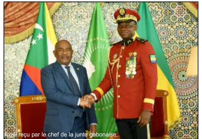
Azali reçu par le chef de la junte gabonaise.

Azali Assoumani a profité de son passage au Gabon pour se rendre à Franceville fief de la famille Bongo dans le Haut-Ogooué où il s'est recueilli devant la tombe de l'ancien président « J'ai d'ailleurs saisi l'opportunité de mon séjour dans ce beau pays, pour aller me recueillir sur la tombe de l'ancien Président gabonais. Puisse-t-il reposer en paix » nous rapporte Beit-Salam. « Azali Assoumani s'est rendu dans la ville de Franceville, dans le Haut-Ogooué afin de rendre un vibrant hommage à Feu le président Omar Bongo Ondimba » a de son côté écrit Afrique Convergence. Lors de ce passage chez les Bongo le président aurait rencontré la famille de l'ex chef d'Etat. Par con-