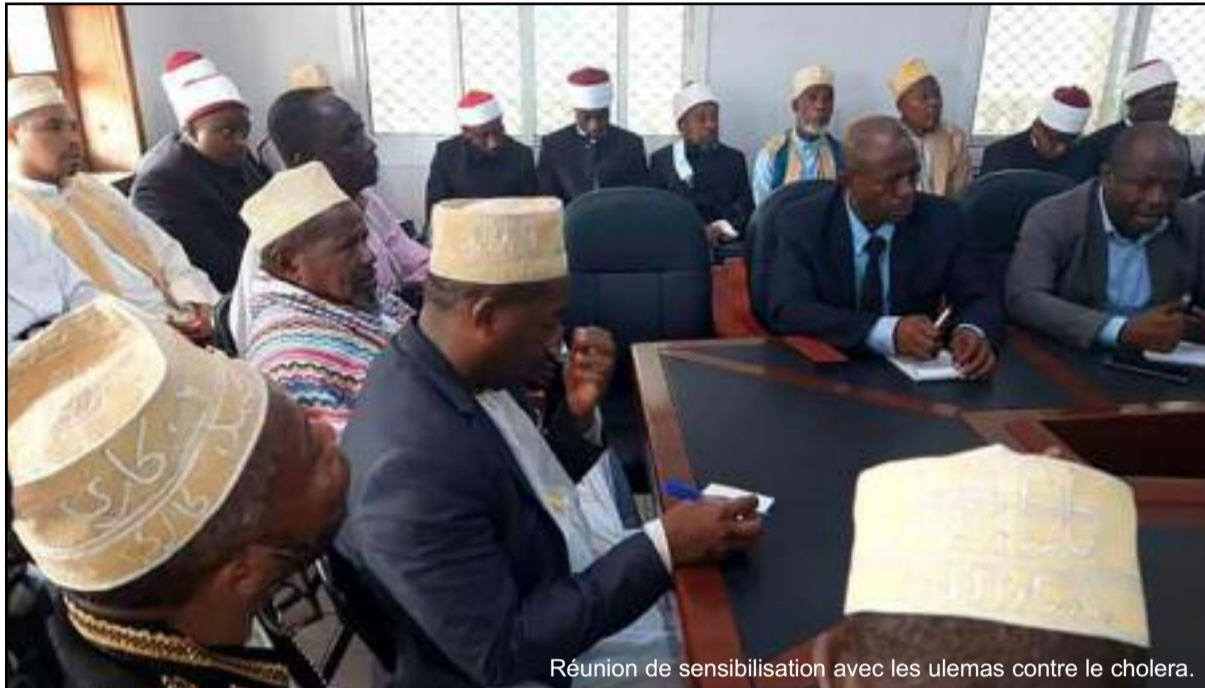
Réunion de sensibilisation avec les ulemas contre le cholera.

Le ministère des Affaires islamiques en collaboration avec le ministère de la Santé sont à pied d'œuvre pour sensibiliser la population contre la maladie de Choléra. Hier dans la matinée, a eu lieu une rencontre présidée par les deux ministres. Y étaient conviés les imams du pays notamment de l'île de Ngazidja, en présence du Mufti de la République, pour venir débattre ensemble afin de trouver les voies et moyens de stopper la propagation du choléra. A l'issue de cette rencontre qui a eu lieu au Muftorat, il en est ressorti que des comités régio-