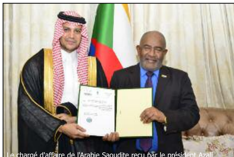
Le chargé d'affaire de l'Arabie Saoudite reçu par le président Azali.