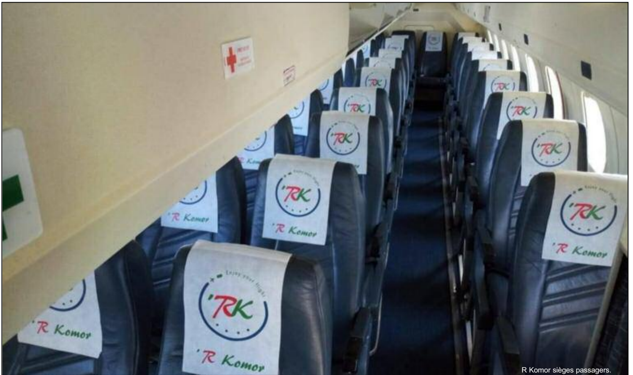
R Komor sièges passagers.