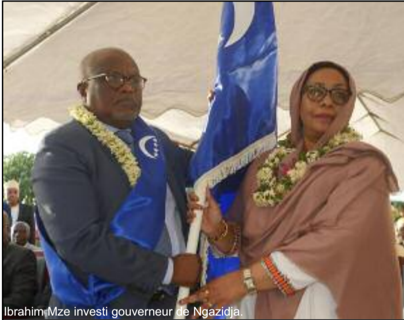
Ibrahim Mze investi gouverneur de Ngazidja.

Investi le jeudi 23 mai dernier au palais du peuple, Ibrahim Mze devient le sixième gouverneur de l'île de Ngazidja. Avec des projets concrets visant à soutenir le PCE, il promet de porter une oreille attentive à l'éducation civique des enfants qui sera basée sur les valeurs de l'islam.