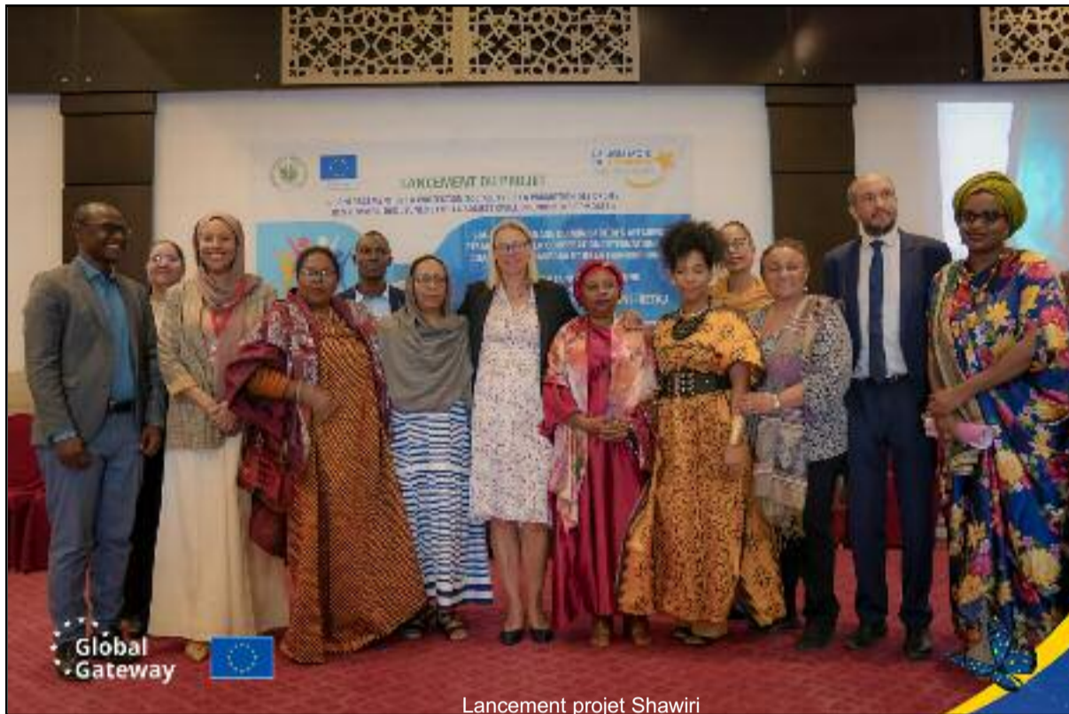
Lancement projet Shawiri

Avec Shawiri les personnes vulnérables dont les femmes, les jeunes et les porteurs de handicap se verront accordées plus d'importance et protégées au niveau sociétal. Le nom "Shawiri" est déjà explicite quant aux motivations du projet. Après des recueils de témoignages basés sur les comportements de l'homme vis-à-vis de la femme en Union des Comores, plus précisément les violences basées sur genre (VGB), l'Union Européenne s'est montrée favorable au financement du projet dans le cadre d'une convention avec le Ministère des Affaires Etrangères. Ainsi, le projet Shawiri doit renforcer la protection sociale et la participation des femmes et des jeunes et la société civile à travers des services d'appui à ces publics et en appuyant les institutions étatiques en charge de leurs