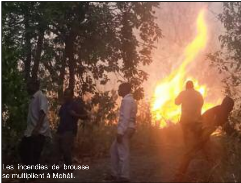
Les incendies de brousse se multiplient à Mohéli.