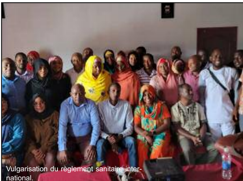
Vulgarisation du règlement sanitaire international.

Poste disponible immédiatement au siège MCTV - ancien bâtiment Comores Aviation - Route de la Corniche - Moroni. Dossier de candidature (CV + Lettre de Motivation) à déposer au siège. Personnes à contacter : +269 325 20 84 / ou +269 333 20 65