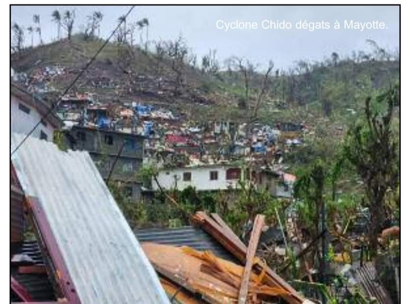
Cyclone Chido dégâts à Mayotte.

De l'autre côté, le gouvernement comorien s'est dit aussi préoccupé par la situation qui prévaut à Mayotte depuis trois jours. « Le président Azali a une pensée toute particulière pour les habitants de l'île sœur de Mayotte, durement frappée par ce phénomène naturel dévastateur » selon un communiqué de Beit-Salam. Dans ce communiqué, la présidence de la république promet que l'Etat « s'engage, alors, à accompagner les efforts de reconstruction tout en apportant son soutien moral, et matériel pour venir en aide aux sinistrés. » Et le chef de l'Etat par décret 24-185/PR du 16 décembre, déclaré une semaine de deuil. « Un deuil national d'une semaine est décrété sur l'ensemble du territoire national, du lundi 16 au dimanche 22 décembre