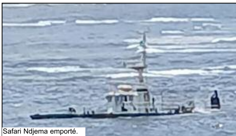
Safari Ndjema emporté.